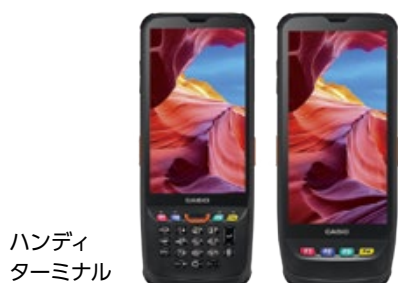
ハンディ ターミナル